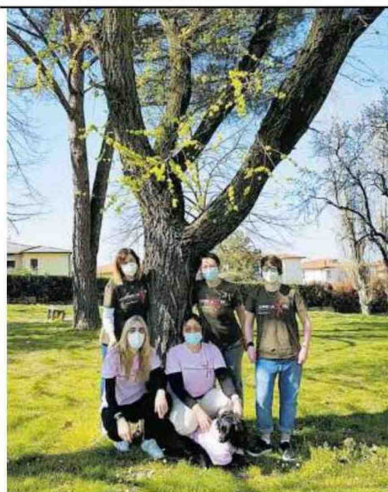
▲ In posa Una della fotografie dell'iniziativa

Oggi l'ultimo giorno Le immagini ricevute saranno pubblicate sui canali social