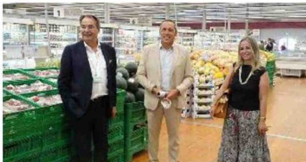
L'inaugurazione della struttura provvisoria della Coop a Ponte a Greve