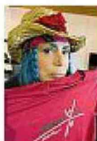
Testimonial Loredana Berté