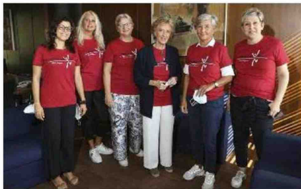
Con la speranza di tornare a correre tutti insieme come prima della pandemia, torna oggi 'Corri la Vita', giunta alla diciannovesima edizione