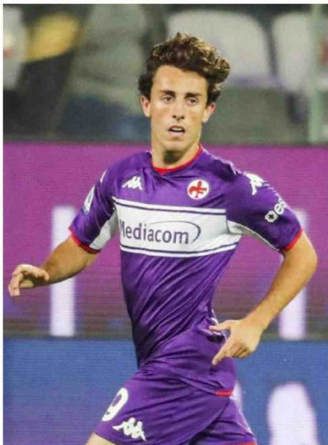
Odriozola è favorito su Venuti per partire dall'inizio a Udine