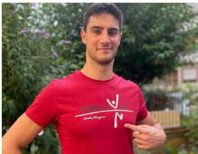
Lorenzo Zazzeri, nuotatore argento olimpico e testimonial di Corri la vita