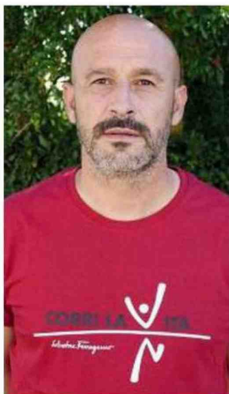
Italiano con la maglia di Corri la Vita

Scontata la presenza dello spagnolo Sull'altra corsia sarà confermato Sottìl