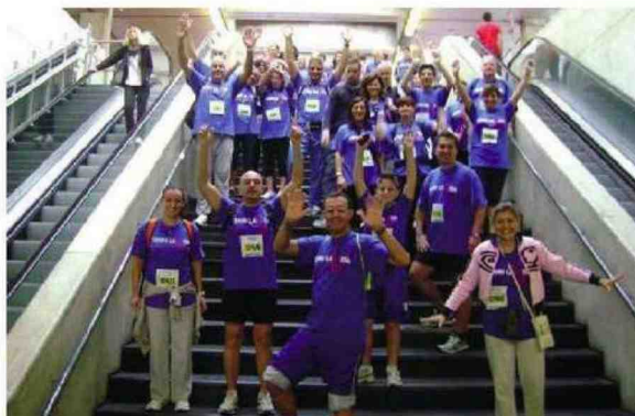
Alcuni partecipanti alla "Corri la vita" degli scorsi anni

programma consolidato degli ultimi anni: non ci sarà il "doppio" percorso podistico, per una decisione presa nell'ottica delle disposizioni di contrasto all'emergenza sanitaria. Gli appassionati di podismo (e non solo) avranno comunque modo di parteciparvi. E lo stesso museo rimarrà aperto il giorno stesso per consentire a tutti gli interessati di visitare le opere. Poggio insomma, punta ad unire sport e arte in vista della ripartenza. Per una buona causa.