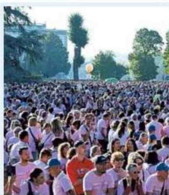
▲ La corsa Una vecchia edizione