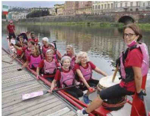
Le straordinarie signore del Dragon Boat