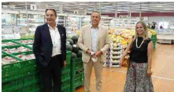
L'inaugurazione della struttura provvisoria della Coop a Ponte a Greve