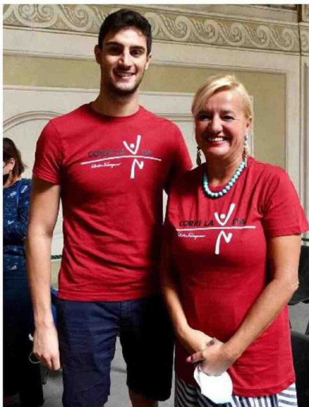
Lorenzo Zazzeri, nuotatore fiorentino medaglia d'argento nella staffetta 4x100 stile libero alle Olimpiadi di Tokyo, con Sara Pagliai, coordinatrice Erasmus Indire

Protagonista anche la cultura con 120 mete in tutta la Toscana